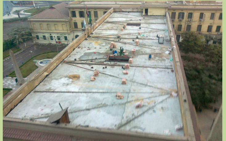
أعمال خرسانة ميول الأمطار الخاصة لسطح الدور الثاني لمبنى الإدارة.