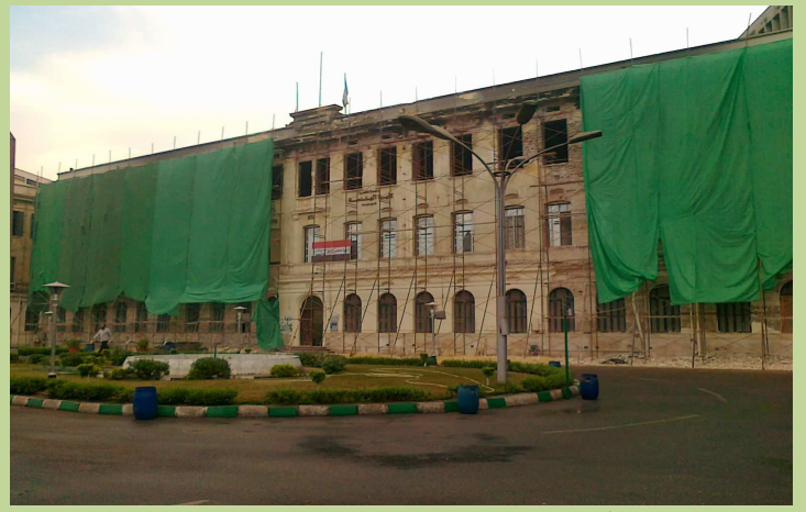
أعمال الإحلال والتجديد لواجهه مبنى الإدارة