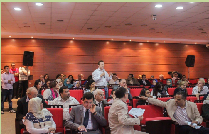
ورشة عمل " نحو مشروعات فعالة لتطوير المناطق العشوائية"