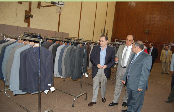
افتتاح المعرض الخاص بملابس الطلاب