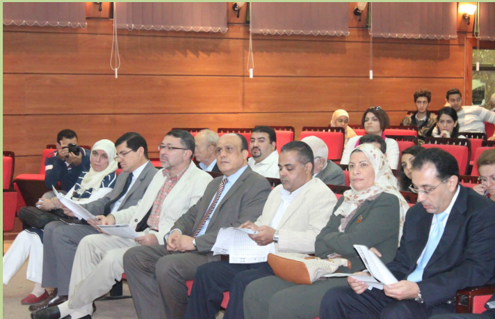
ورشة عمل " نحو مشروعات فعالة لتطوير المناطق العشوائية"