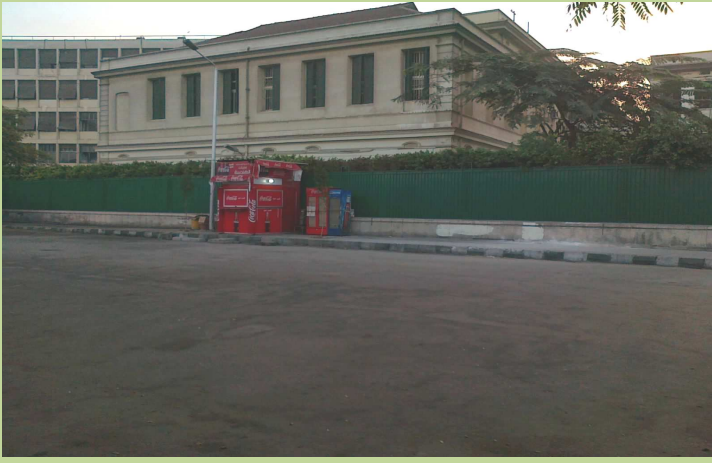
تجليد السور الحديدي الفاصل بين الكلية والجراج الخارجي بألواح الصاج