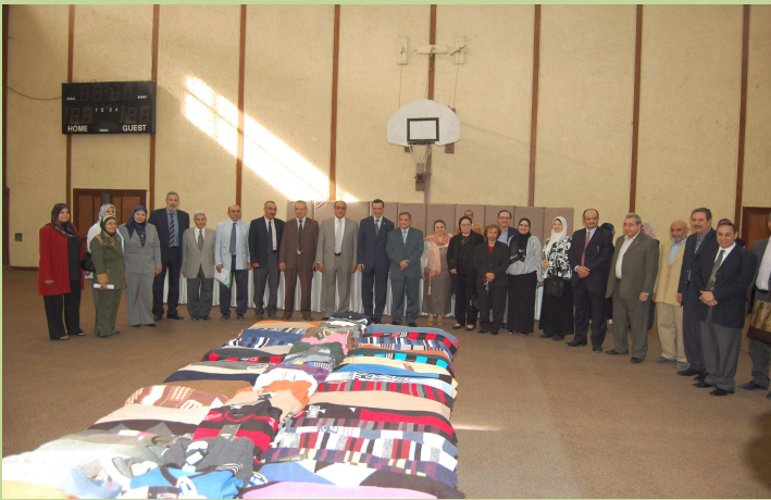
افتتاح المعرض الخاص بملابس الطلاب