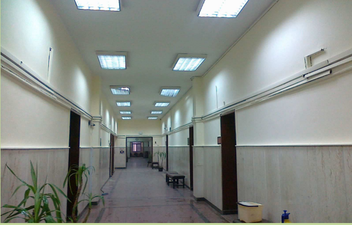
طريقة مبنى الإدارة بعد أعمال الدهان