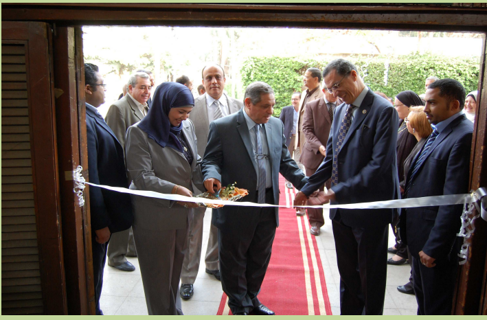
افتتاح المعرض الخاص بملابس الطلاب