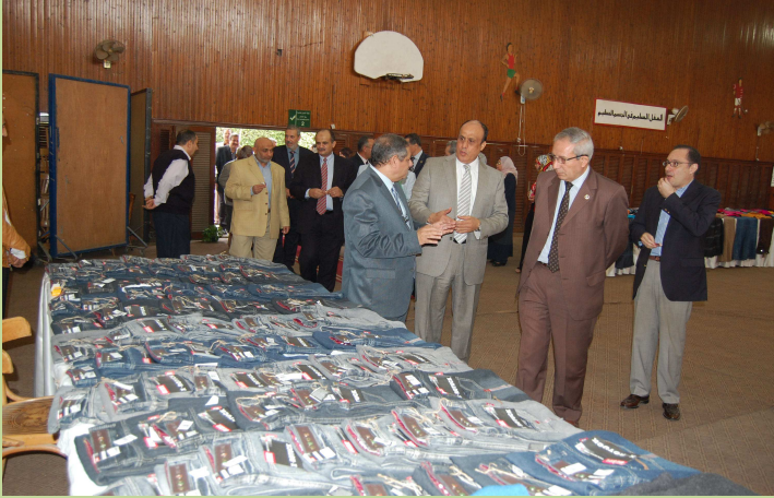
افتتاح المعرض الخاص بملابس الطلاب