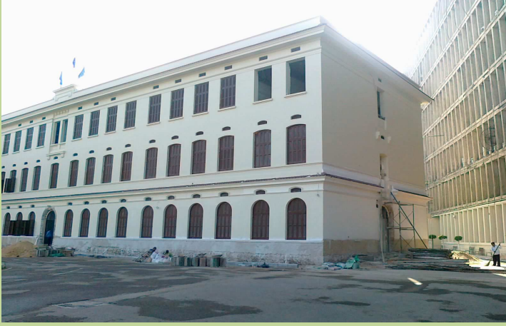
الواجهة الامامية لمبنى الادارة بعد اعمال الدهانات