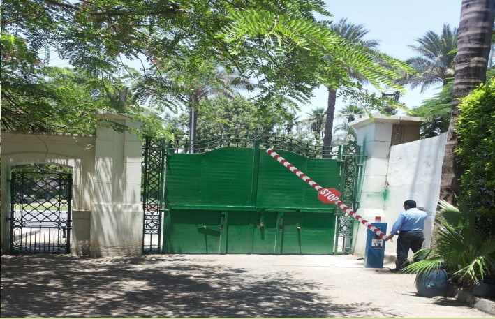
بوابة كهربائية للتحكم في دخول وخروج السيارات من باب اعدادي